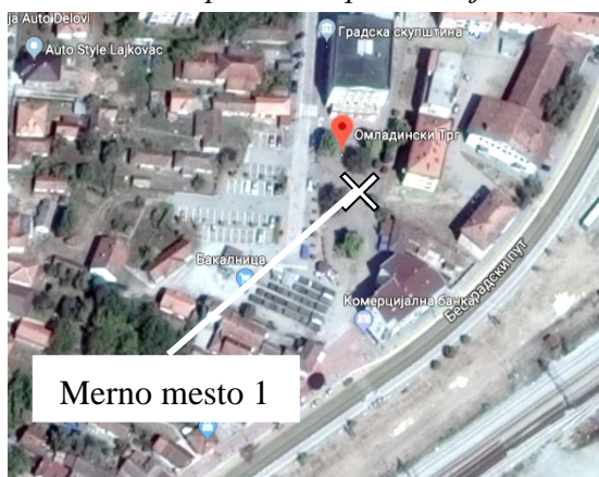
Merno mesto 1