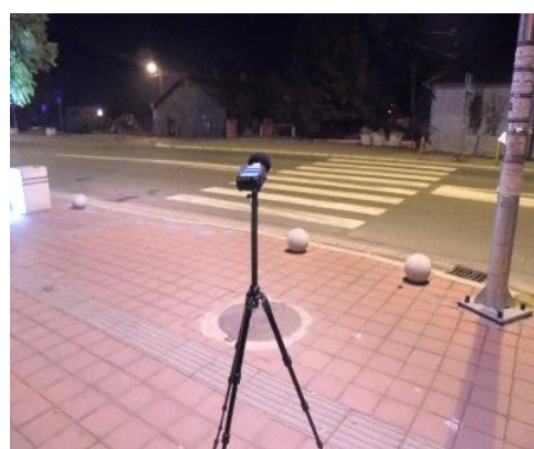
Slika br. 10 Merno mesto 5, merna tačka V