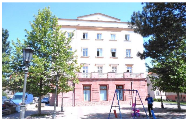
Slika br. 1 Opštinska uprava Lajkovac