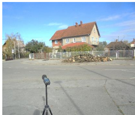
Slika br. 8 Merno mesto 4, merna tačka IV