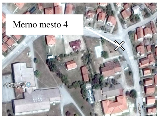
Slika br. 9 Merno mesto 4, merna tačka IV