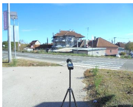
Slika br. 4 Merno mesto 2, merna tačka II