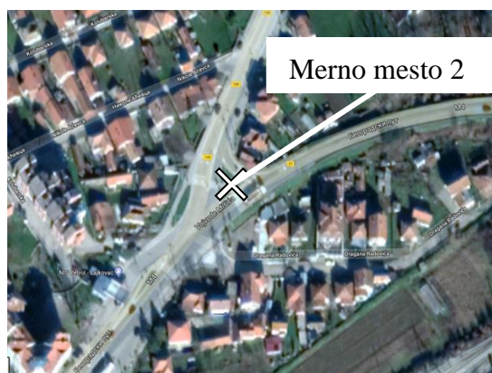
Merno mesto 2