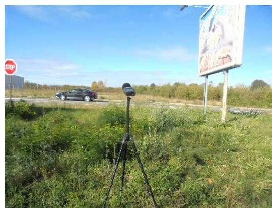
Slika br. 6 Merno mesto 3, merna tačka III