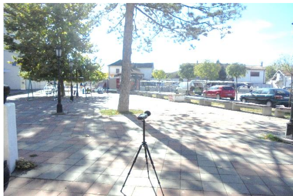
Slika br. 2 Merno mesto 1, merna tačka I