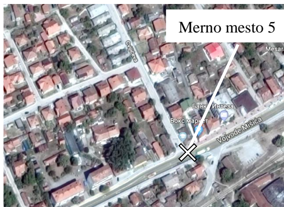
Slika br. 11 Merno mesto 5, merna tačka V