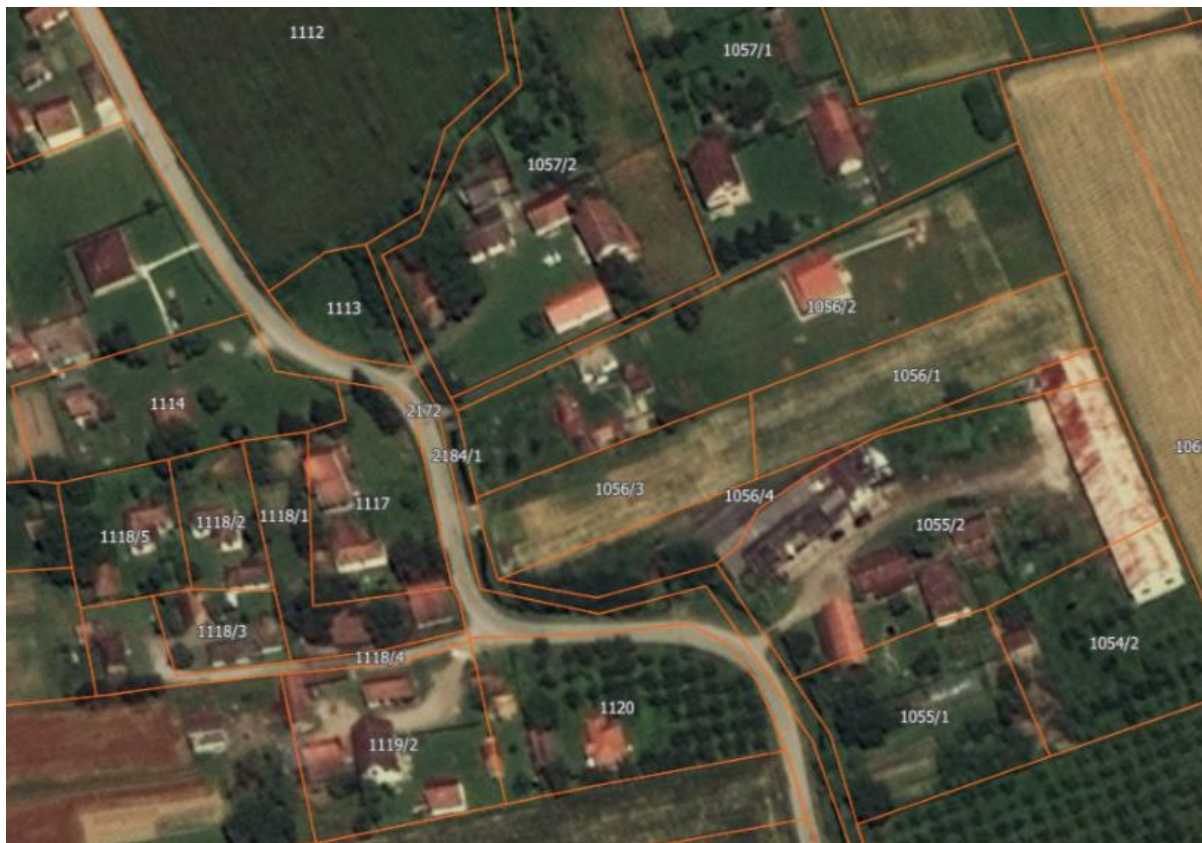
Слика 1.

Предметна катастарска парцела 1056/1 КО Пепељевац налази се у границама плана Измена и допуна Просторног плана општине Лајковац – усаглашавање са одредбама Закона о планирању и изградњи („Службени гласник општине Лајковац“, бр. 15/2018 и 8/2019), Уређајна основа за насеље Пепељевац и припада зони – рурално становање планирано .