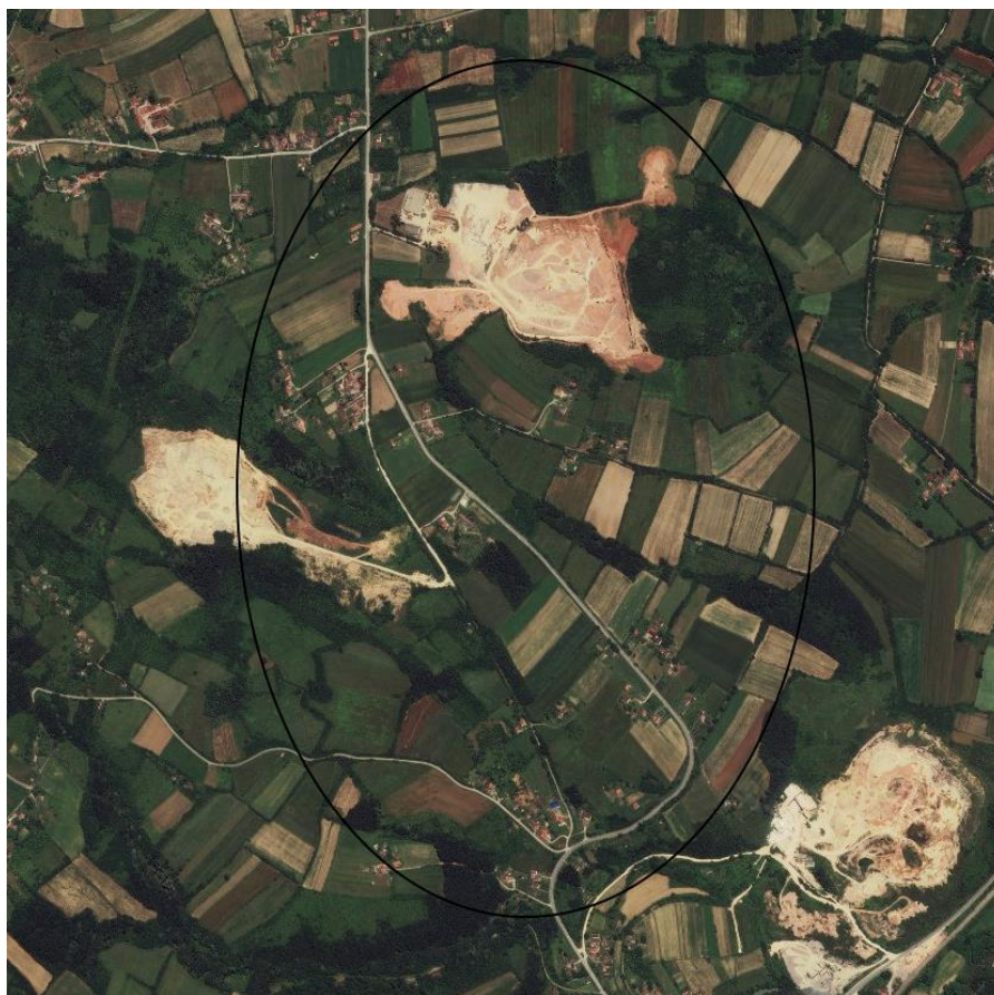
Слика 1..

У складу са идејним решењем, Изградња мешовитог вода - нисконапонске мреже 0,4кV и СН вода 10кV Словац – Степање , планирана на кат. парцелама бр. 436/2, 1605, 606, 607, 611, 613, 612, 616, 620, 708, 707, 705, 703, 695, 696, 697, 816, 815, 823, 824, 825/2, 825/4, 826/1, 826/3, 826/2, 831/1, 831/2, 832, 833/2, 1548 све КО Степање.